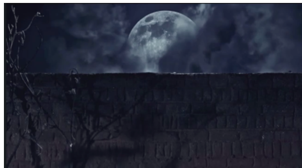
Nacht in JUNK GIRL