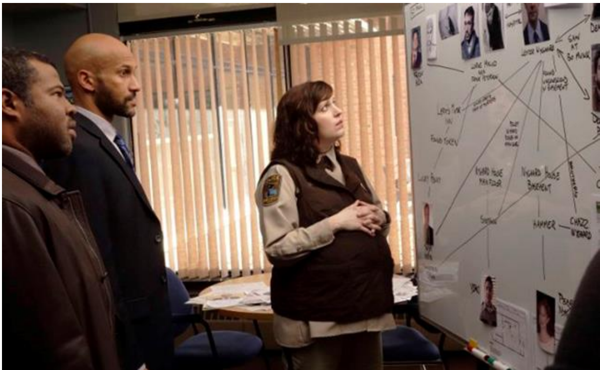
(FARGO, R: Div., A: Noah Hawley, Joel Coen, Ethan Coen)